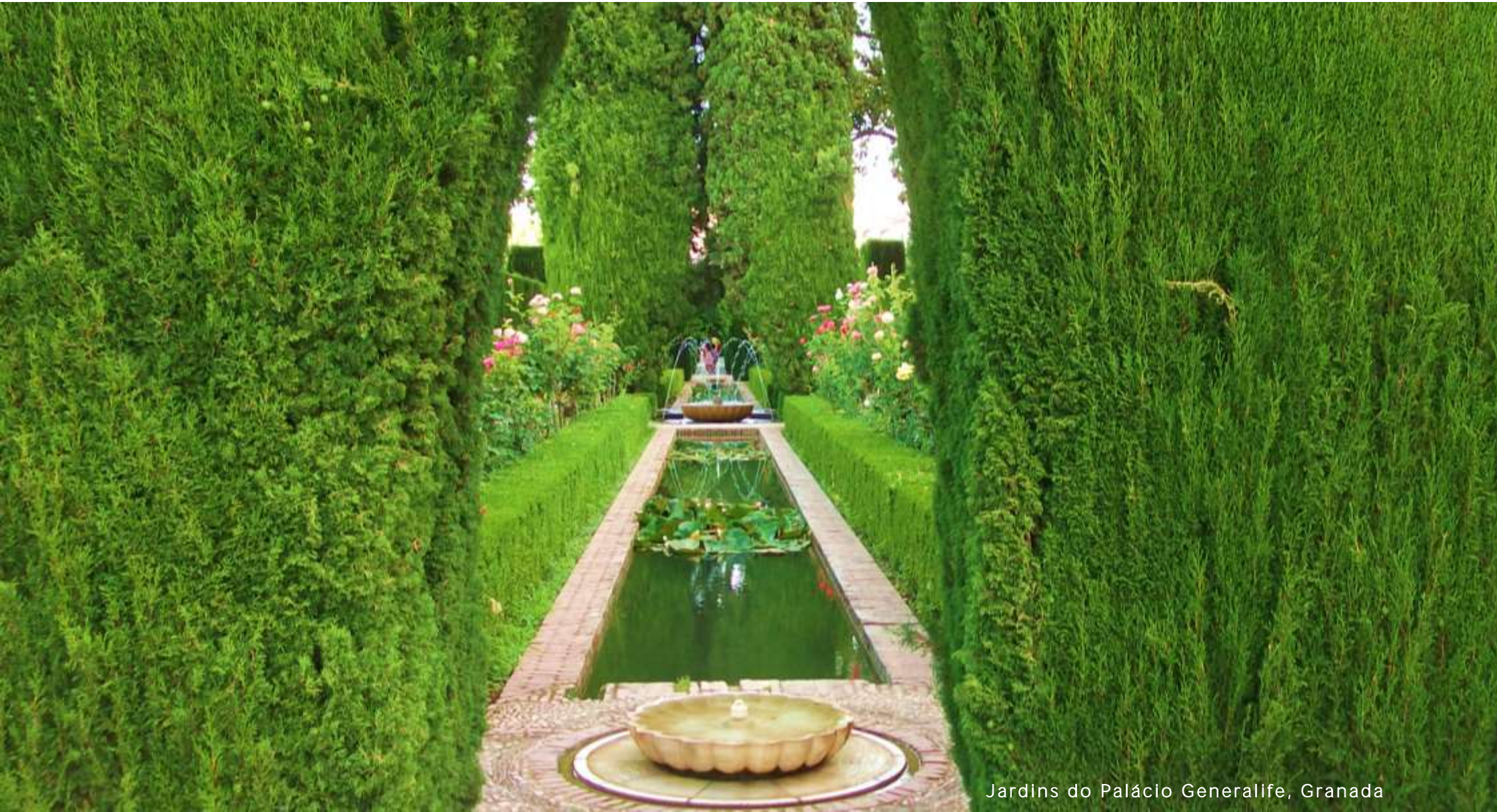
Jardins do Palácio Generalife, Granada