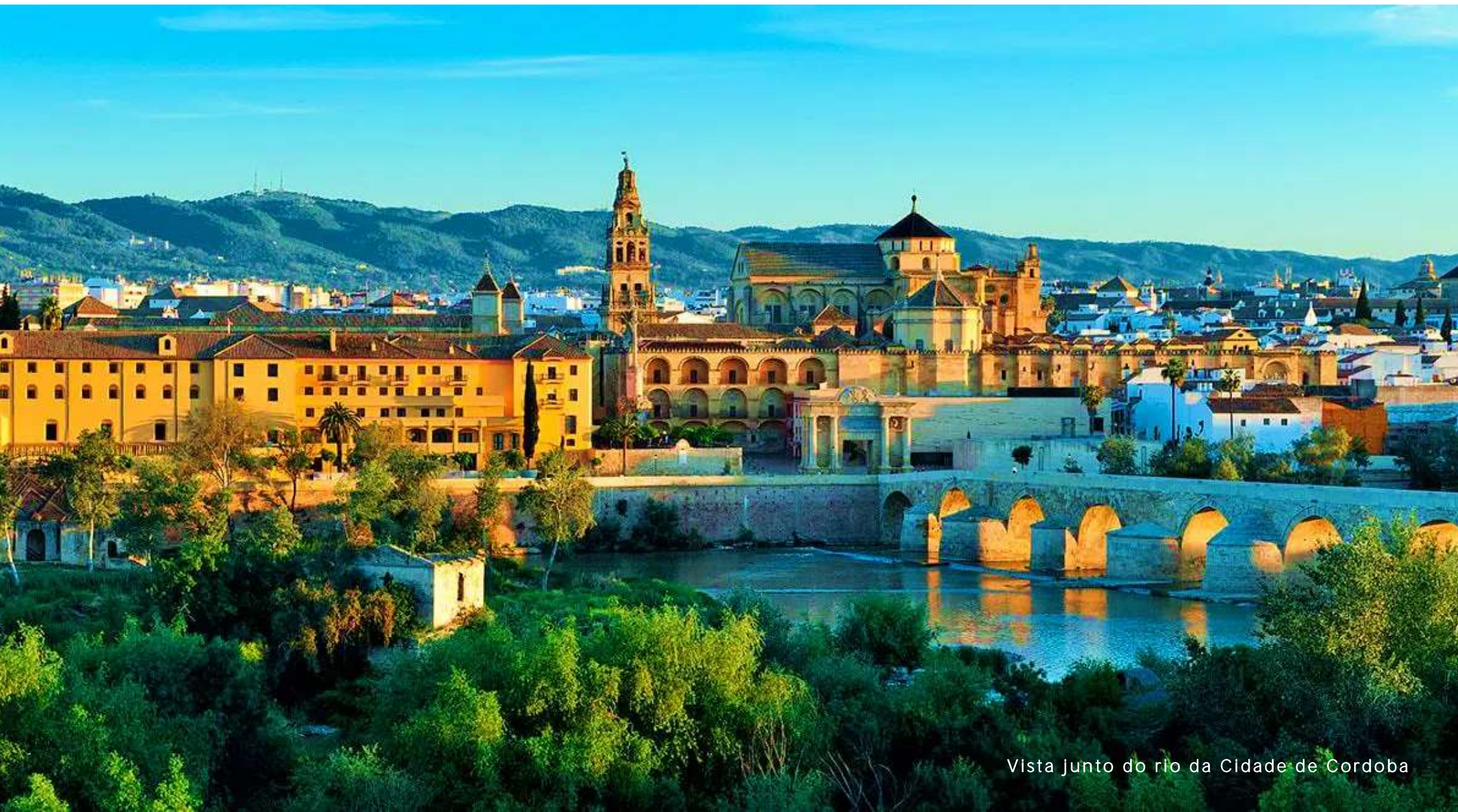
Vista junto do rio da Cidade de Cordoba