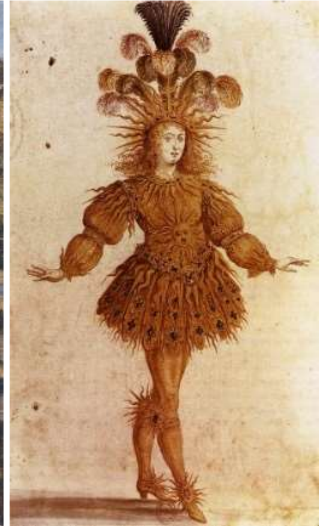
1 - Luís XIV com traje de Apolo, Rei-Sol, em ballet de 1653, Henri Gissey (c. 1621-c. 1673), desenho, 167x260 cm. Paris: Bibliothèque nationale de France. 2 - Le Château de Versailles en 1668, Pierre Patel (1605-1676), c. 1668, óleo sobre tela, Museu do Palácio de Versalhes.