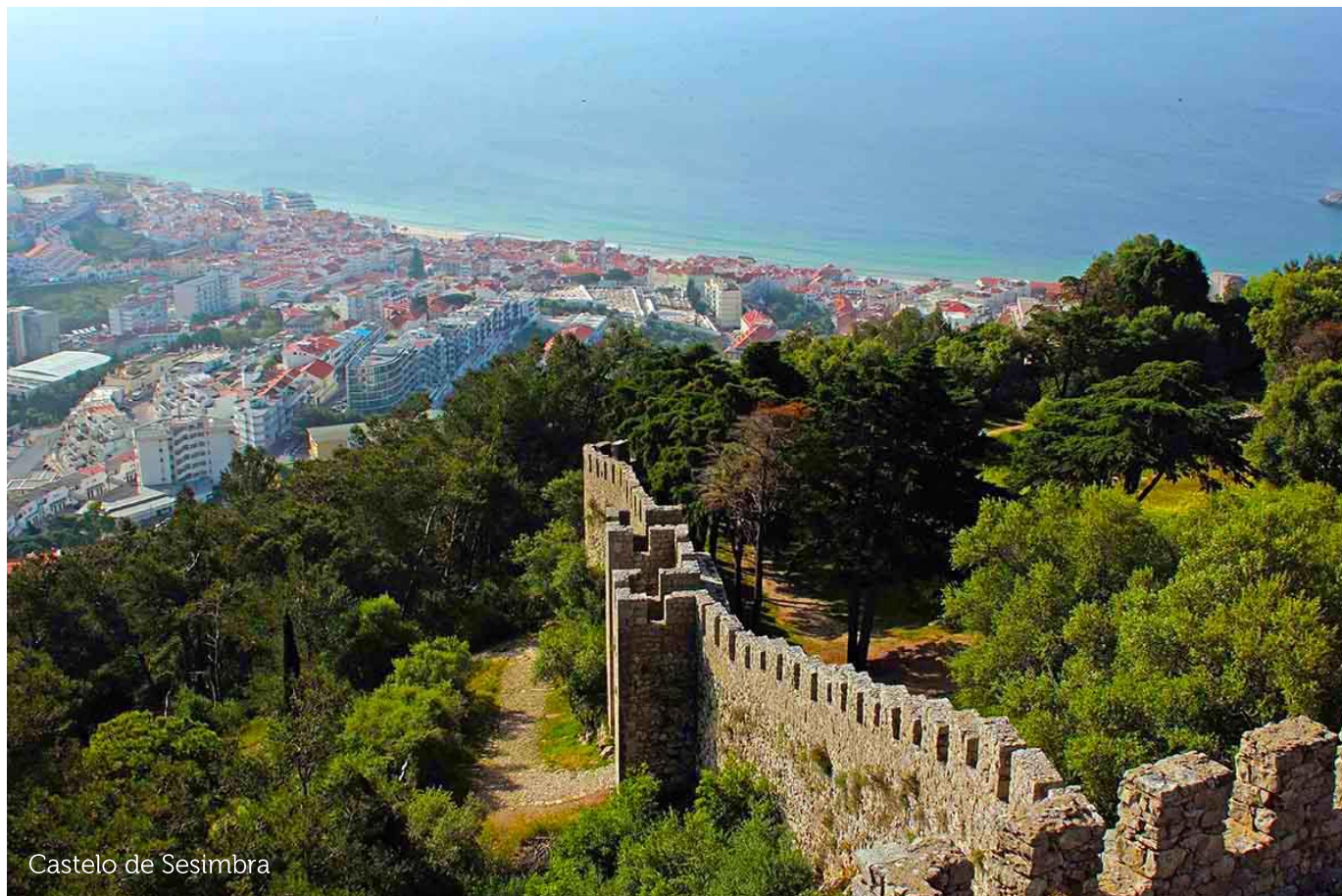
Castelo de Sesimbra