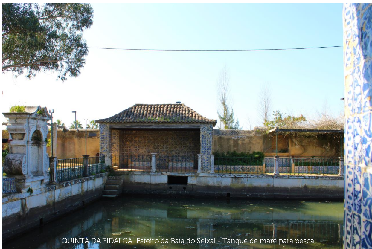
“QUINTA DA FIDALGA” Esteiro da Baía do Seixal - Tanque de maré para pesca

Chama-se Dia da Espiga e comemora-se no Dia da Ascensão, uma festa católica portuguesa celebrada 39 dias depois da Páscoa, sendo que em alguns municípios é feriado. Como tradição forma-se um ramo que é tradição levar-se para casa.