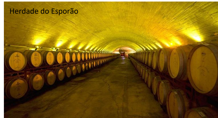
Herdade do Esporão