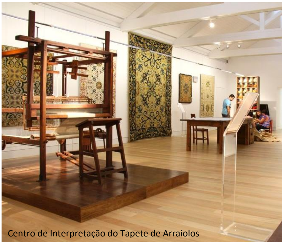
Centro de Interpretação do Tapete de Arraiolos