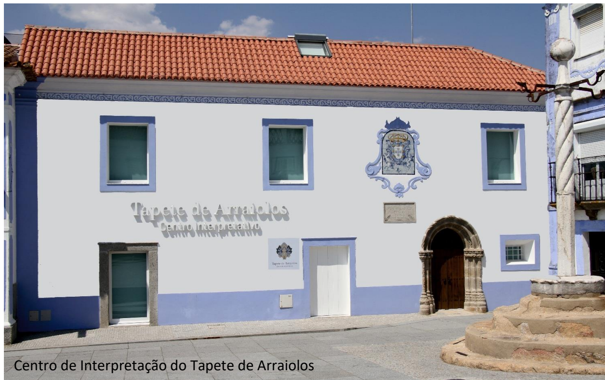
Centro de Interpretação do Tapete de Arraiolos