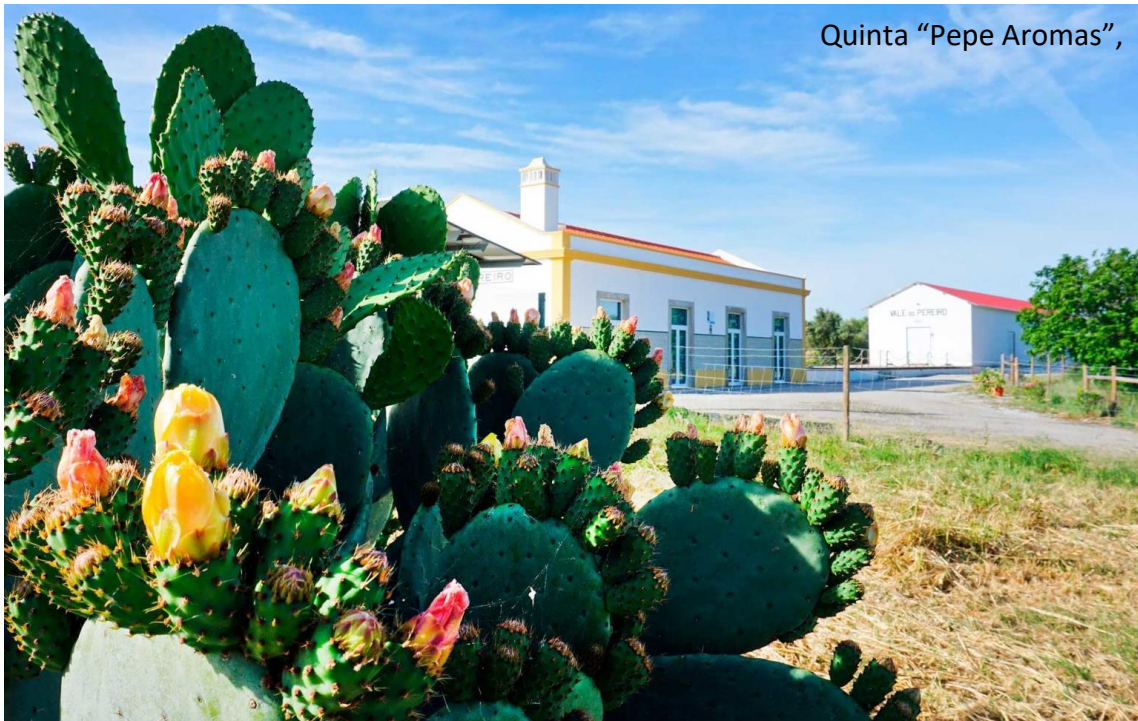
Quinta “Pepe Aromas”,

3º Dia – 18 abril (quinta-feira) | ÉVORA / VALE DO PEREIRO / ARRAIOLOS / LISBOA (+-122 km)