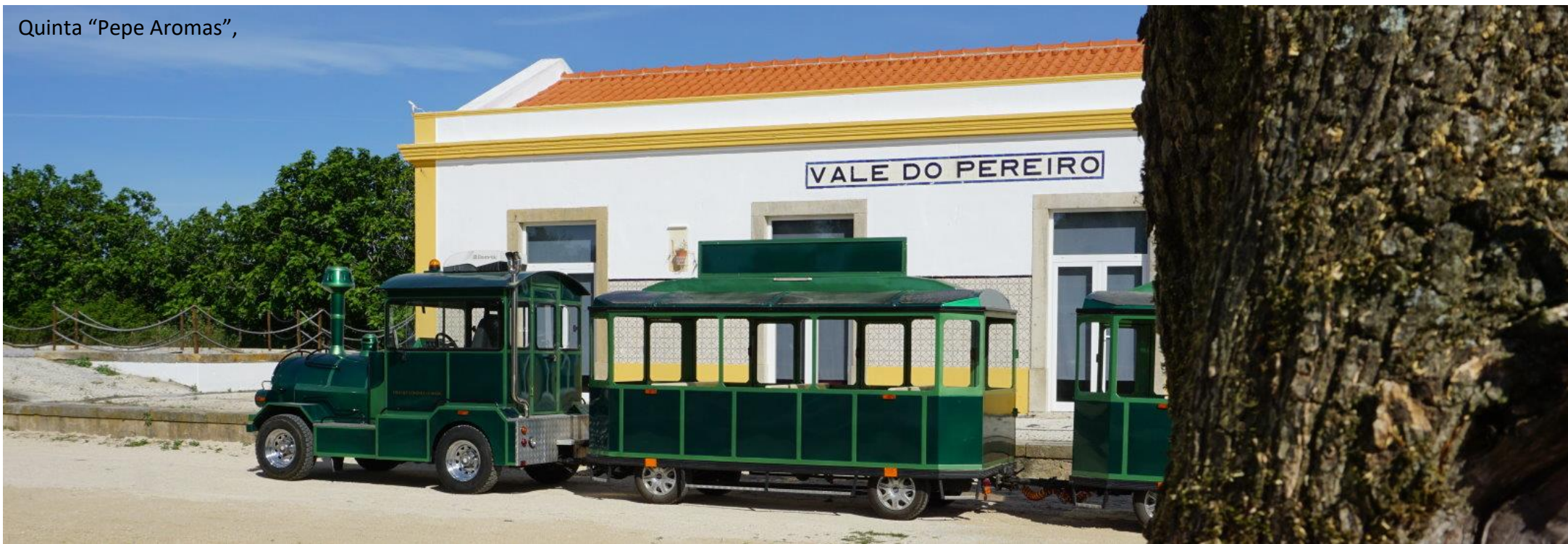
Quinta “Pepe Aromas”,

Aqui ficaremos a conhecer um pouco mais sobre a produção de figos-da-índia e todos os produtos que se podem fazer a partir deste fruto. Faremos também um passeio de comboio turístico pelo montado alentejano, por entre as azinheiras e sobreiros e pomares de figueiras-da-índia, numa viagem intemporal por paisagens magníficas, e para terminar a visita iremos almoçar , numa experiência única de sabores tradicionais e locais.