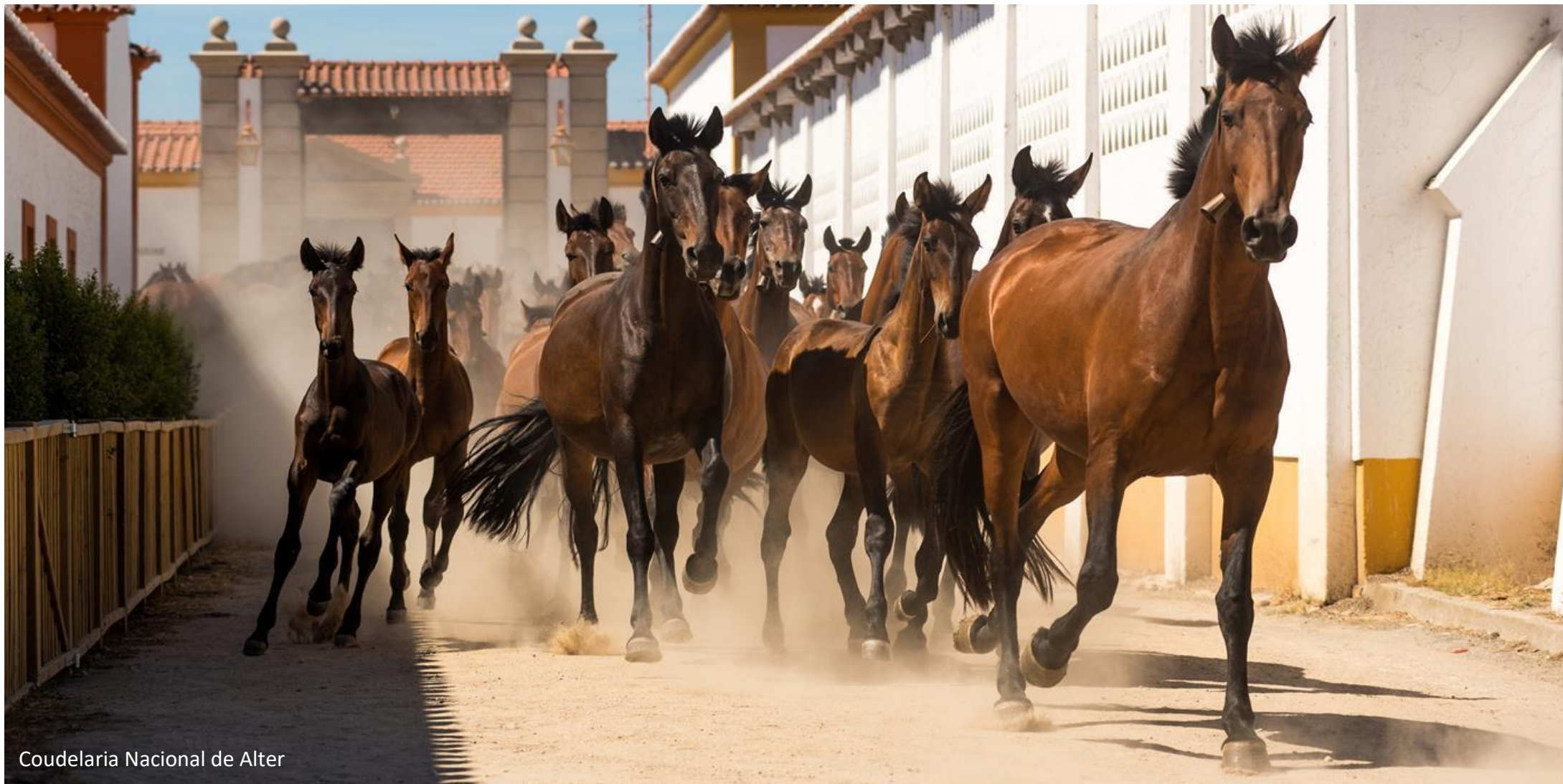
Coudelaria Nacional de Alter