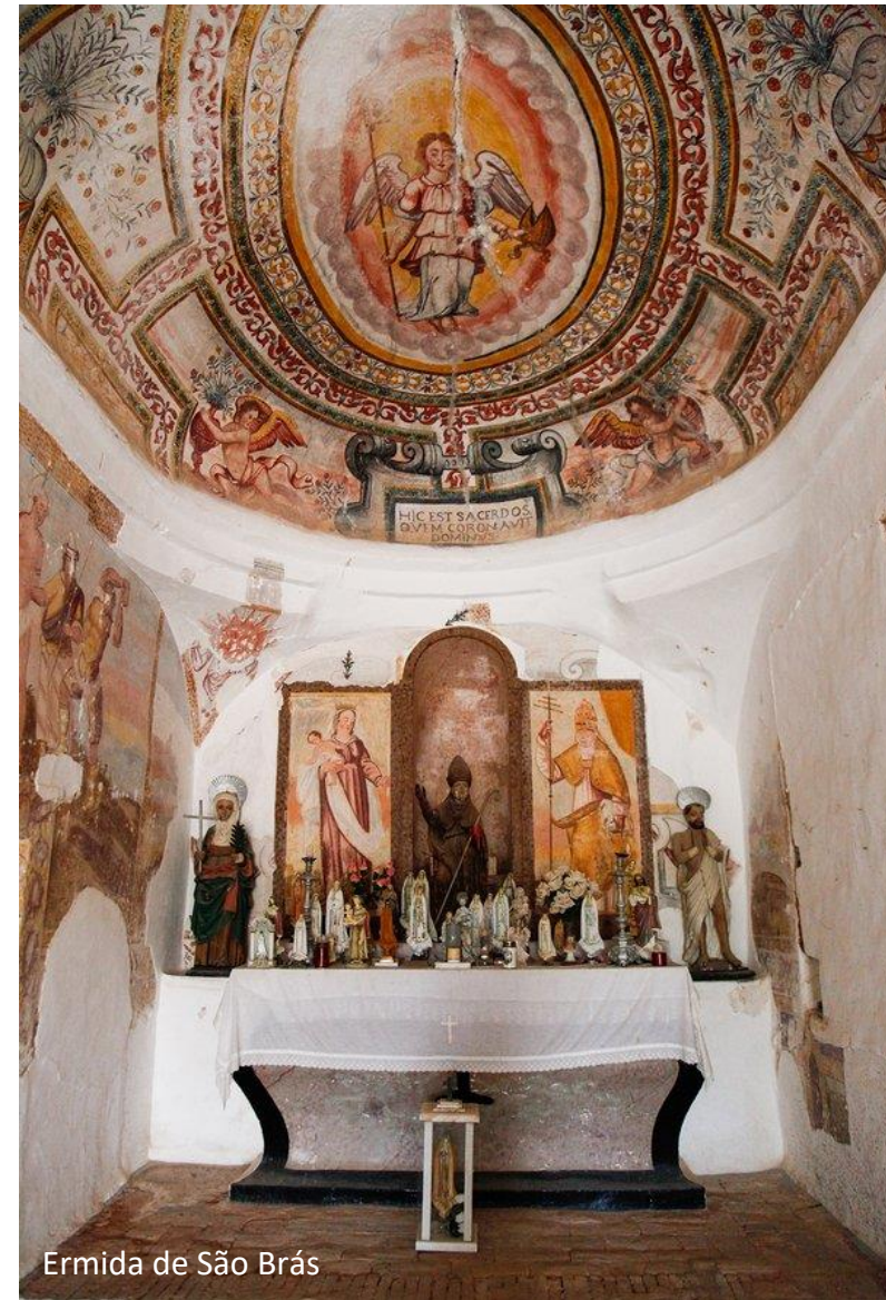
Ermida de São Brás