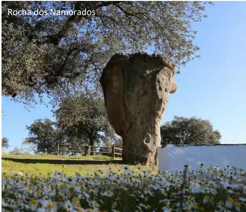
Rocha dos Namorados

No final das visitas, regresso a Évora. Jantar e alojamento.