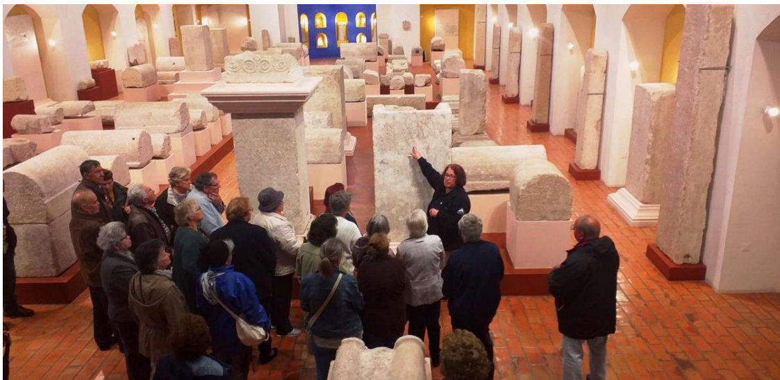
Museu Arqueológico de S. Miguel de Odrinhas