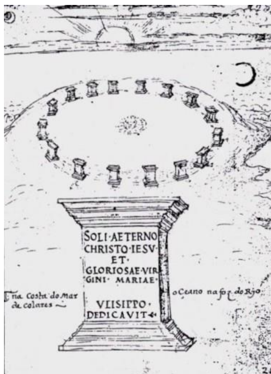
Desenho de Francisco de Holanda, séc. XVI