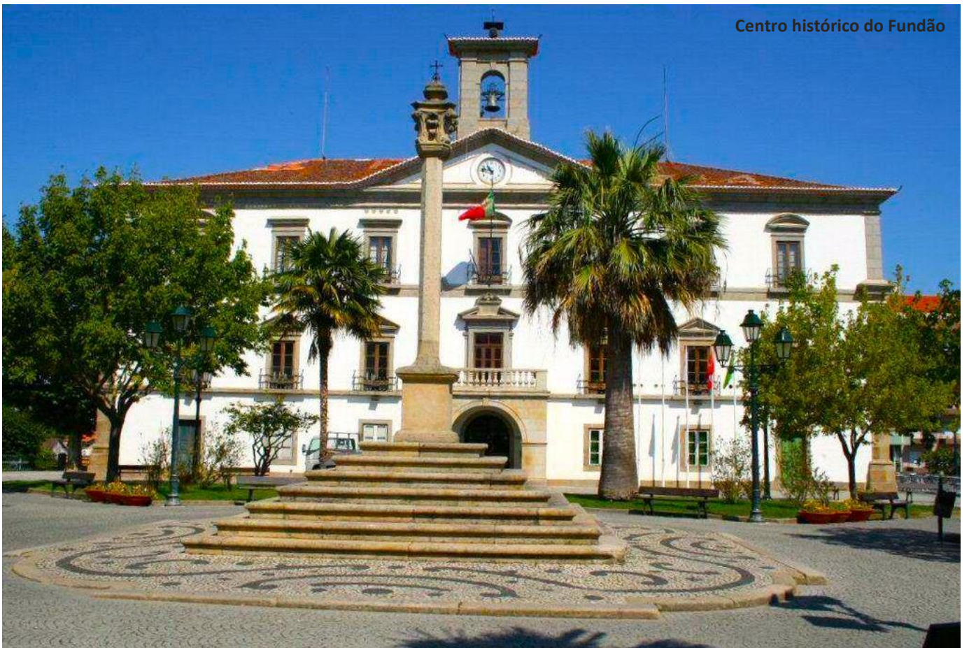
Centro histórico do Fundão