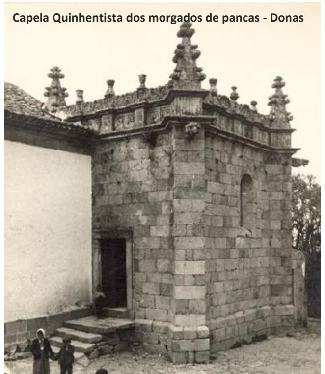
Capela Quinhentista dos morgados de pancas - Donas