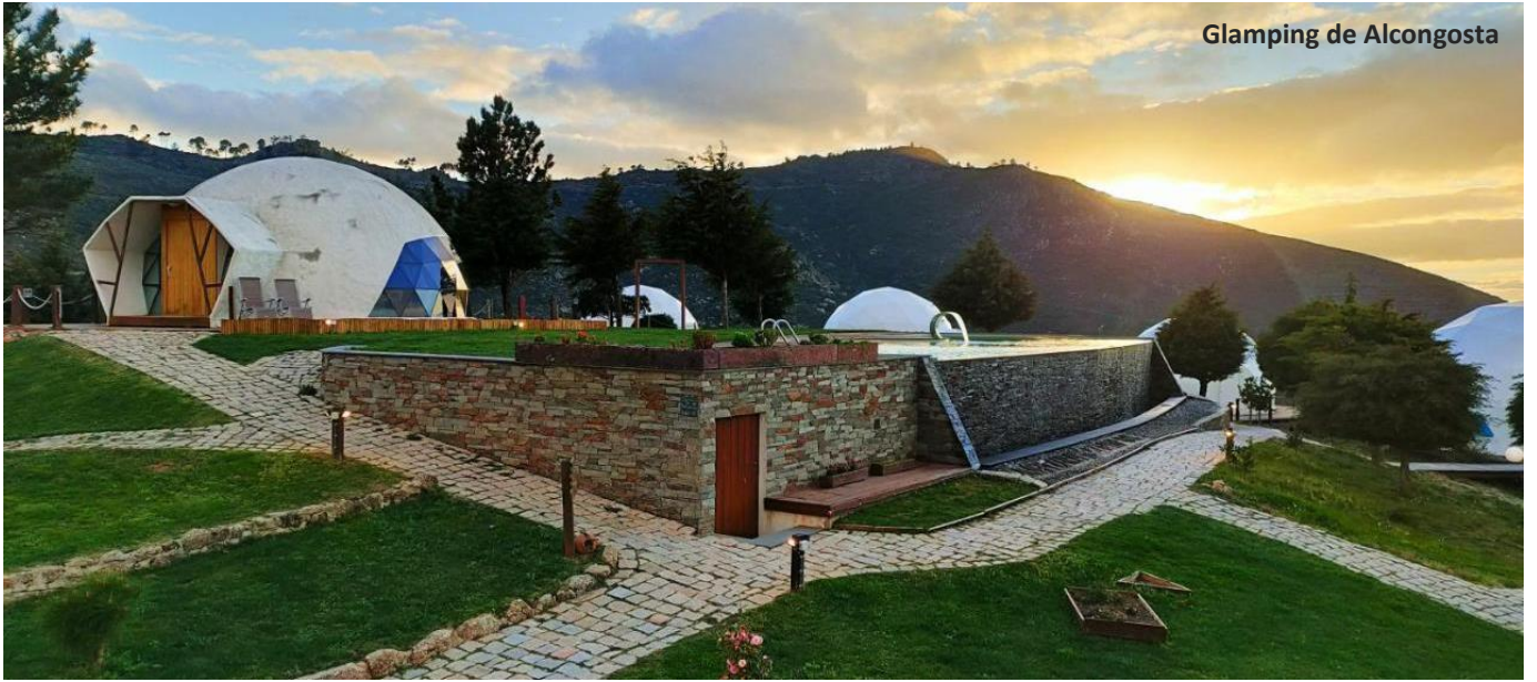
Glamping de Alcongosta