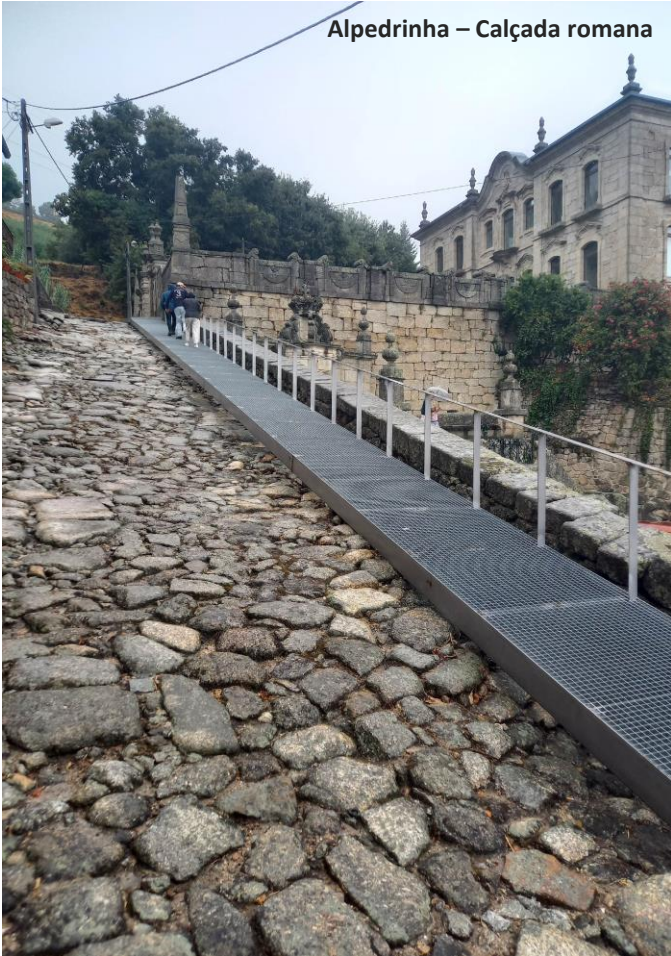
Alpedrinha – Calçada romana